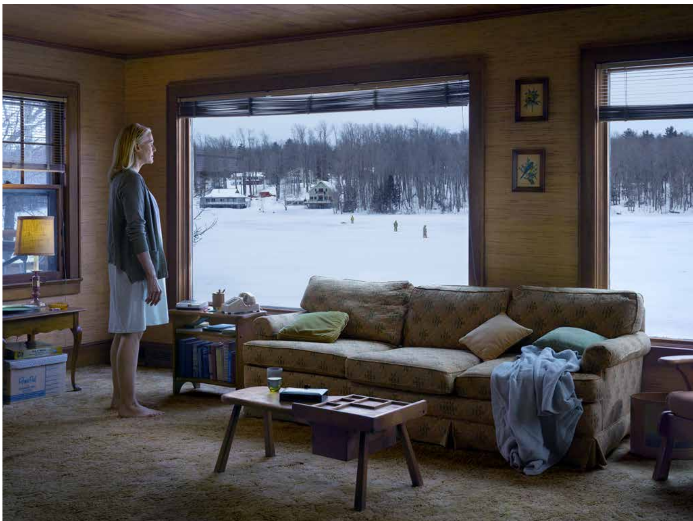
The Disturbance - Série Cathedral of the Pines - 2014 - Impression pigmentaire numérique - 114,5 x 146,2 cm (encadré) - Collection privée