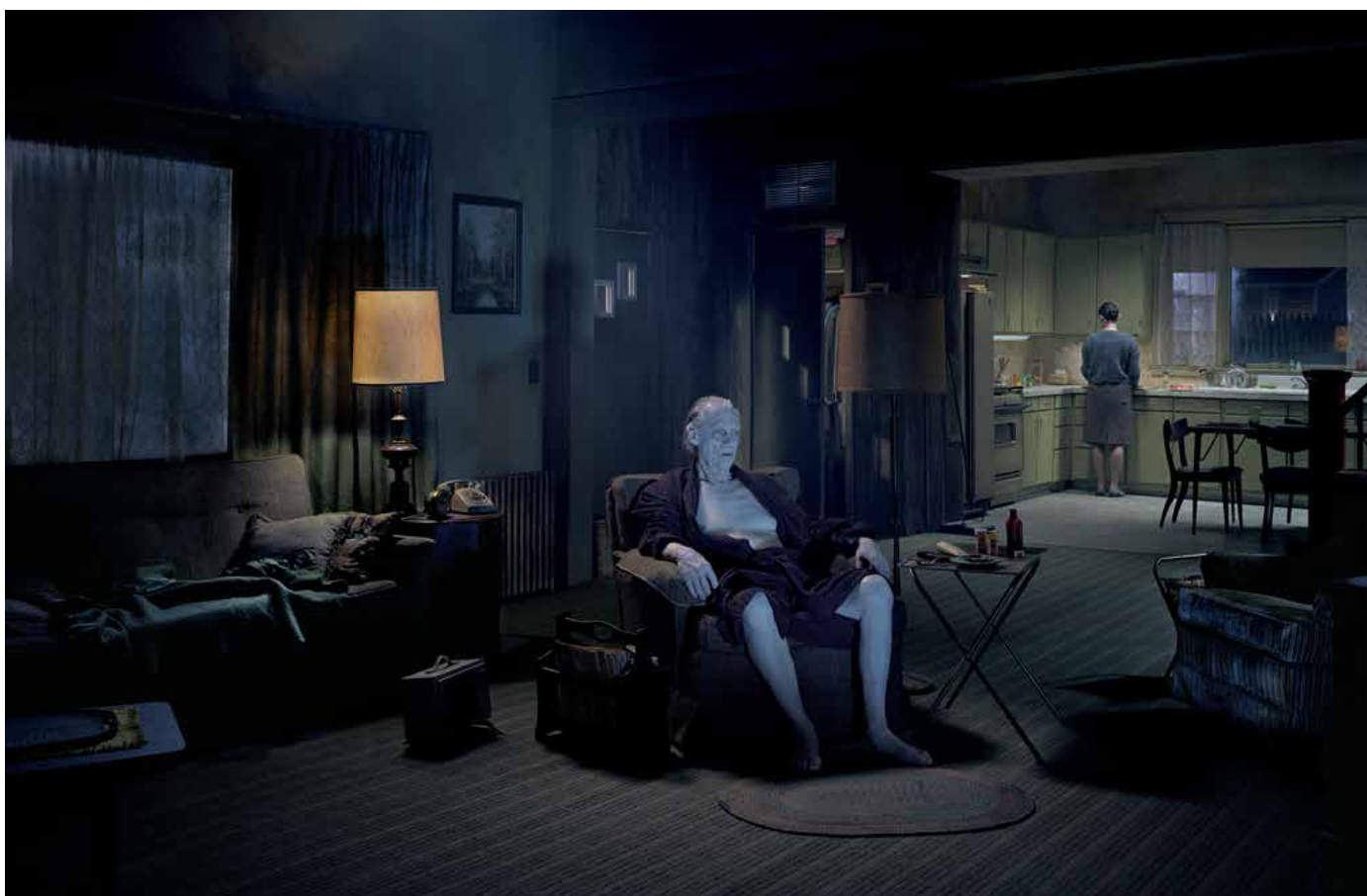
Sans titre - Série Beneath the Roses - 2007 - Impression pigmentaire numérique - 148,6 x 227,3 cm (encadré) - Collection du Cnap, Paris

Le regard que nous portons sur ces photographies s'exerce toujours dans l'éblouissement d'un champ pictural réglé à la perfection dans ses moindres éléments. Tout, dans ses images, est parfaitement orchestré pour développer cette curiosité dont témoignent souvent les spectateurs de ses œuvres face à l'étrangeté des scènes auxquelles ils se confrontent, dans une fascination pour cette "inquiétante étrangeté", ce dérangement infime de l'ordre des choses du quotidien.