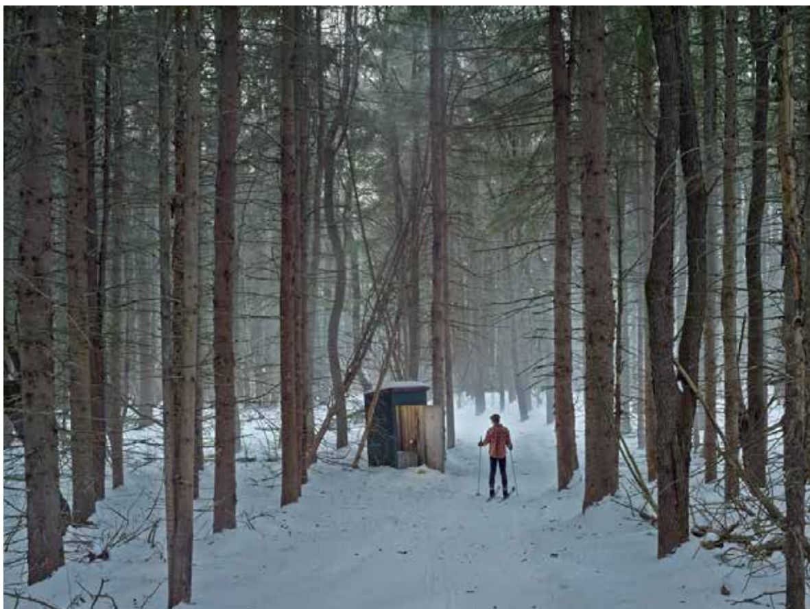
Cathedral of the Pines - Série Cathedral of the Pines - 2014 - Impression pigmentaire numérique - 114,5x146,2 cm (encadré) Collection privée, Paris

Il fallait sans doute à Gregory Crewdson cet élément localisé sur un territoire familier, qui plus est connecté à l'enfance et dont le nom est symboliquement fécond, pour que cette charge de créativité empêchée, refoulée, puisse se sublimer par une simple étincelle localisée à l'endroit même où, plus de quinze ans auparavant, il observait le crépitement fascinant des lucioles en parade amoureuse qui donnèrent naissance à la série Fireflies .