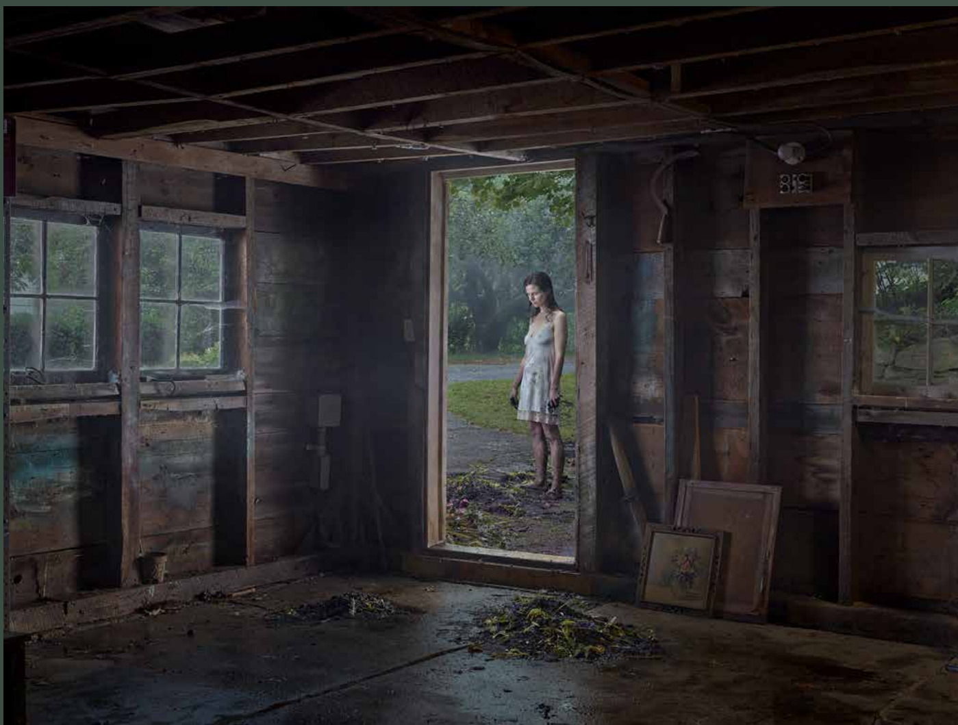
The Shed - Série Cathedral of the Pines - 2013 - impression pigmentaire numérique - 114,5x146,2 cm (encadré) Collection FRAC Auvergne